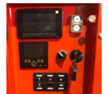
Panel de control digital