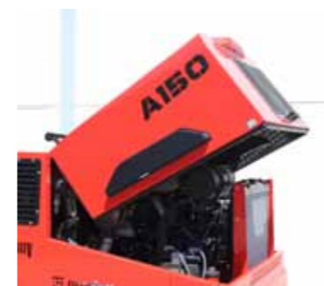
Capota abatible, fácil acceso al motor

Hopper with "S" valve with disc and wear plate