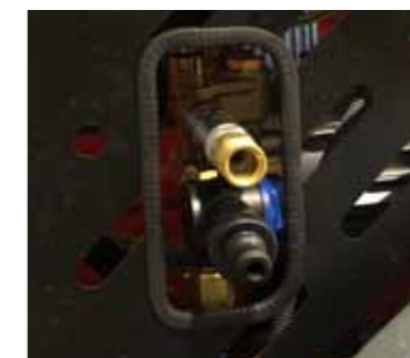
Hidrolimpiadora de presión

Grill for concrete with electric vibrator