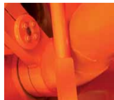
Tolva con válvula "S" con disco y placa de desgaste

Arnabat offers a complete range of accessories and spare parts to keep your pump in perfect working. Correct maintenance and the use of original spare parts will guarantee optimum functions and safety.