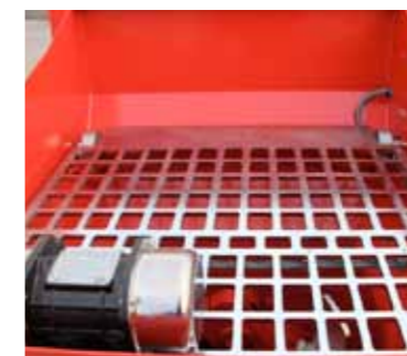
Rejilla para hormigón con electrovibrador

Removable canopy, easy access to the engine